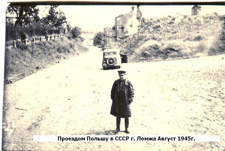
Проездом Польшу в СССР г. Ломжа Август 1945г.